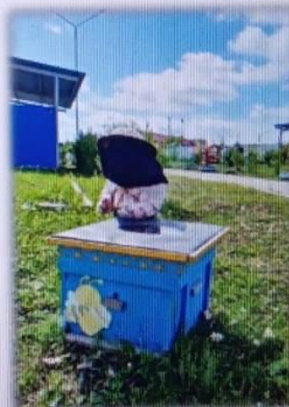
МАДОУ детский сад № 14

При проектировании среды учитываются местные этнопсихологические, социокультурные, культурно-исторические и природно-климатические условия, в которых находится ДОО