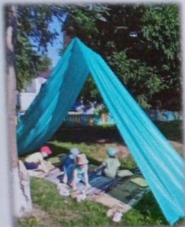
МАДОУ детский сад № 4