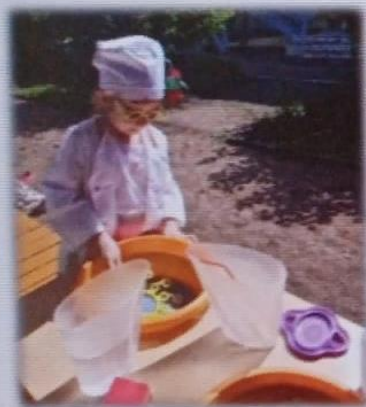
МАДОУ ЦРР АК