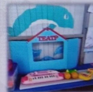
МАДОУ детский сад № 6