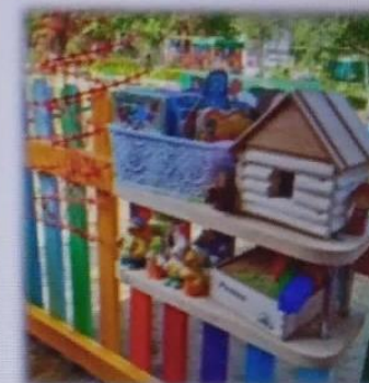
МАДОУ детский сад № 6