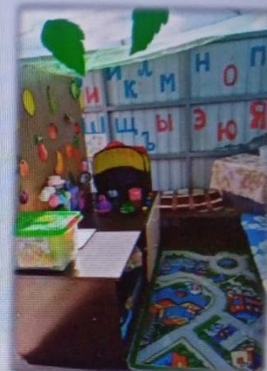
МАДОУ детский сад № 14