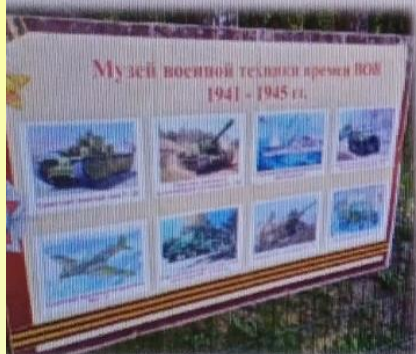
МАДОУ детский сад № 6