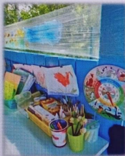
МАДОУ детский сад № 6