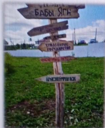
МАДОУ детский сад № 14