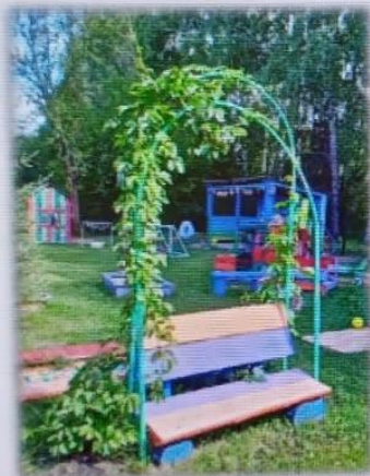
МАДОУ детский сад № 6