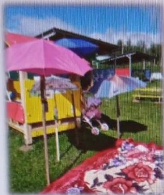
МАДОУ детский сад № 14