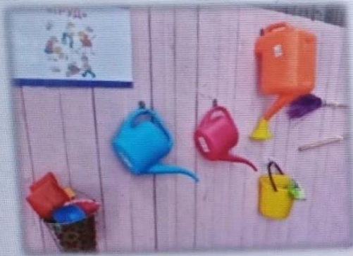
МАДОУ детский сад № 5