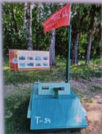
МАДОУ детский сад № 4