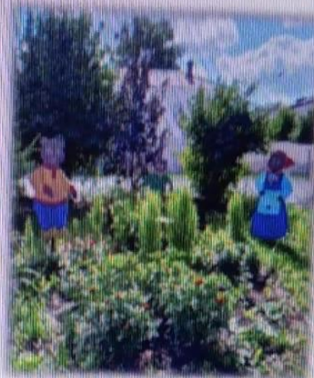
МАДОУ ЦРР АД