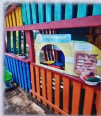
МАДОУ детский сад № 4