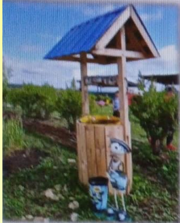
МАДОУ детский сад № 14