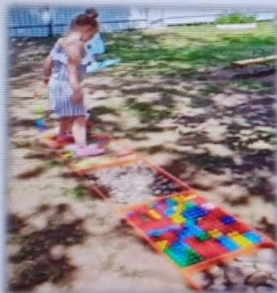
МАДОУ детский сад 5