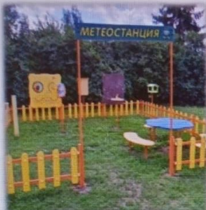
МАДОУ детский сад № 6