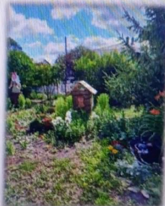
МАДОУ ЦРР АД

Элементы русской народной культуры способствуют освоению детьми социокультурных особенностей русского народа.