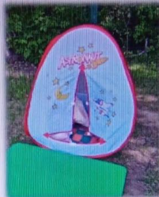
МАДОУ детский сад № 6