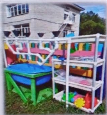
МАДОУ детский сад № 6