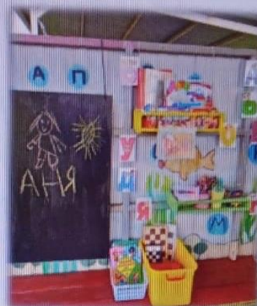
МАДОУ детский сад № 6