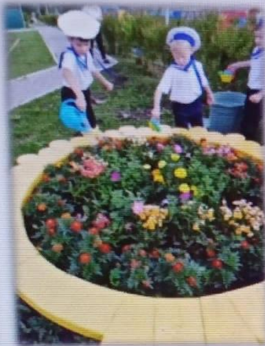
МАДОУ детский сад № 6