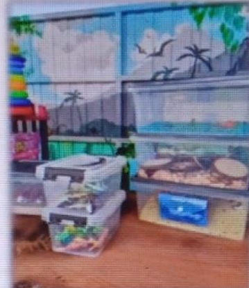
МАДОУ детский сад № 14