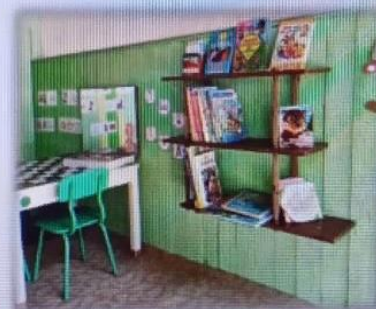
МАДОУ детский сад № 5