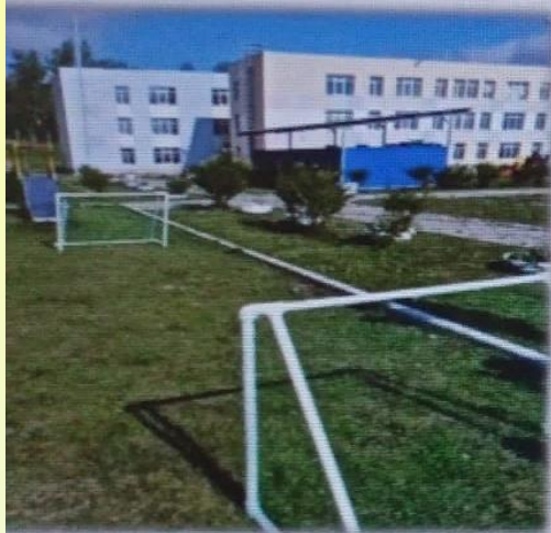
МАДОУ детский сад № 14