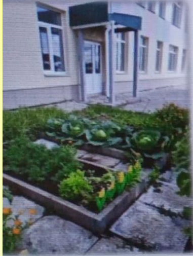
АДОУ детский сад № 14