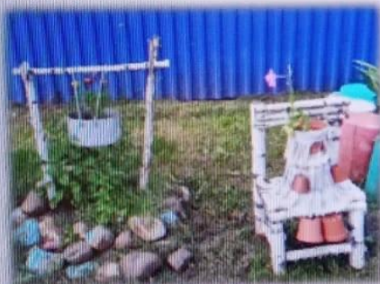
МАДОУ ЦРР АД