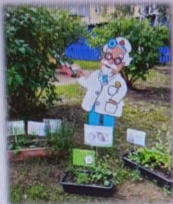
МАДОУ ЦРР АД