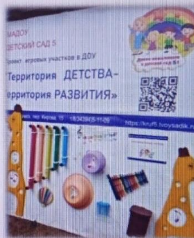
МАДОУ детский сад № 5