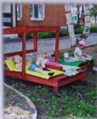
МАДОУ детский сад № 4