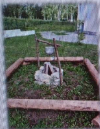
МАДОУ детский сад № 14