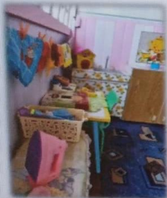
МАДОУ детский сад № 5