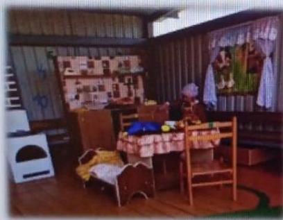
МАДОУ ЦРР АД