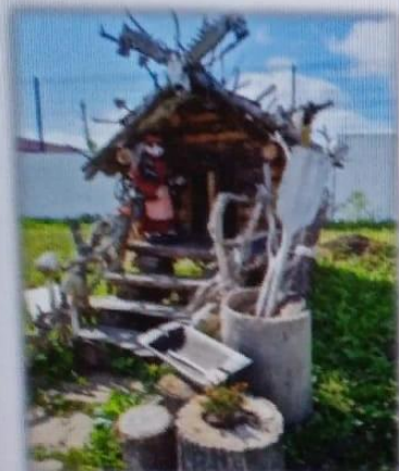
МАДОУ детский сад № 14