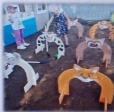
МАДОУ ЦРР АК