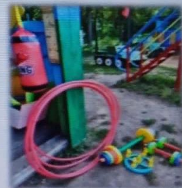
МАДОУ детский сад № 6