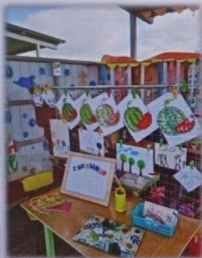
МАДОУ детский сад № 6