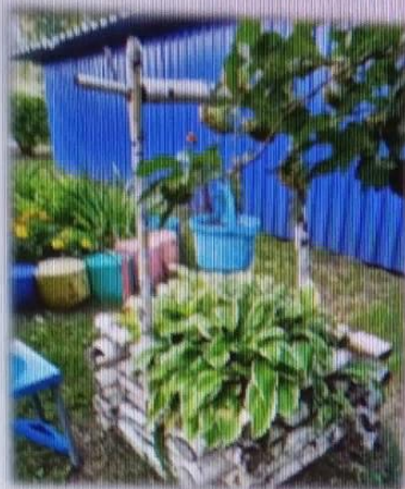
МАДОУ ЦРР АД