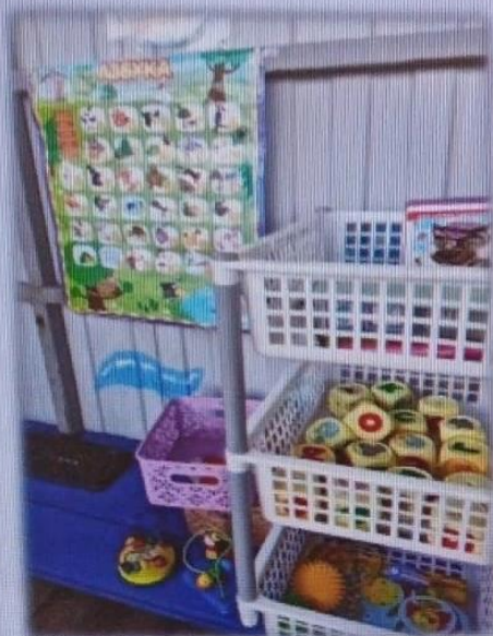
МАДОУ детский сад № 6