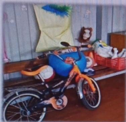
МАДОУ ЦРР АК