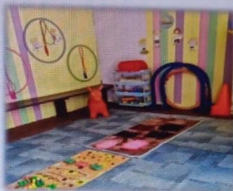
МАДОУ детский сад № 5