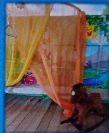
МАДОУ детский сад № 14