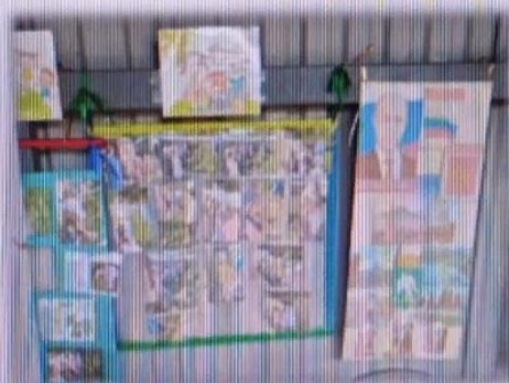
МАДОУ ЦРР АД

Создание условий для развития патриотизма, чувства гордости за свою страну и народ