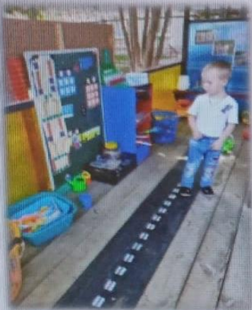
МАДОУ детский сад 17