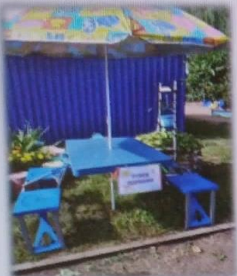
МАДОУ ЦРР АД