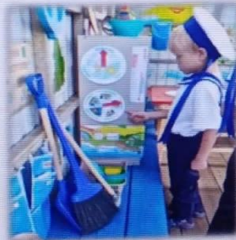
МАДОУ детский сад № 6