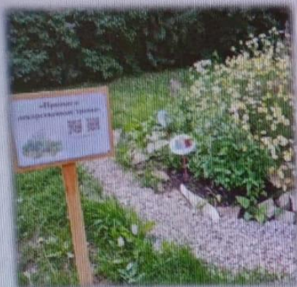
МАДОУ детский сад № 6